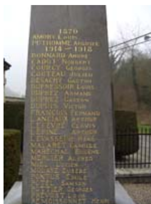
Monument aux morts d'Autrêches (Oise)

Symbole de la Grande Guerre, le monument aux morts est l'étape première d'une étude sur le parcours des combattants. Outre la retranscription des noms inscrits sur le monument aux morts de la commune, le chercheur devra comparer la liste obtenue avec les autres listes de noms : victimes civiles, militaires morts des autres conflits. L'étude du monument en tant que tel est aussi essentielle puisqu'elle permet d'approcher l'état d'esprit de la population au moment de sa commande (étudier le matériau, le style, les symboles, les intervenants : architecte, sculpteur, maître d'ouvrage, entrepreneur...)