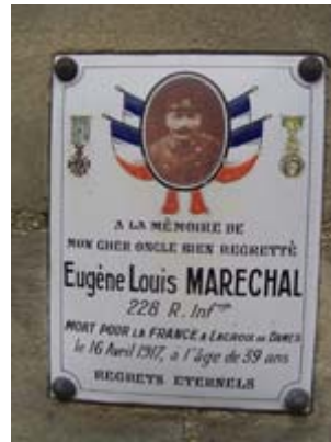
Plaques mortuaires à Autrêches (Oise)

Pour honorer la mémoire des disparus, des plaques ont pu être apposées sur des murs et des monuments élevés dans les communes. Ces objets de commémoration ont pu être installés pendant la guerre ou après guerre. Il convient donc de distinguer si leur construction a une origine régimentaire, publique ou familiale. Les plaques peuvent présenter un portrait photographique du soldat. Une visite approfondie de la commune est donc indispensable. L'église et les chapelles peuvent aussi posséder des témoignages graphiques intéressants (vitraux, médailler, ex-voto, drapeaux...)